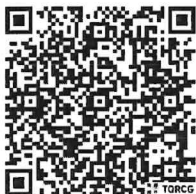
(นายสมชวน รัตนมังคลานนท์) อธิบดีกรมปศุสัตว์